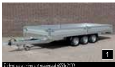
1 Tridem uitvoering tot maximaal 6050x2400