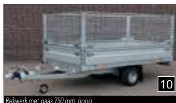
10 Rekwerk met gaas 750 mm. hoog