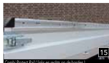
15 Combi Protect Rail (links en rechts op de borden)