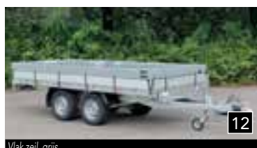
12 Vlak zeil, grijs