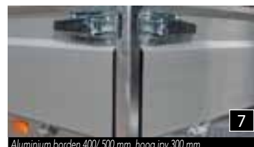
7 Aluminium borden 400/ 500 mm. hoog ipv 300 mm.