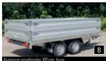
8 Aluminium opzetborden 300 mm. hoog