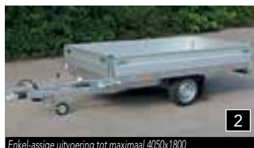
2 Enkel-assige uitvoering tot maximaal 4050x1800