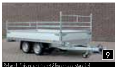
9 Rekwerk, links en rechts met 2 liggers incl. stapelrek