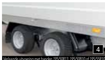
4 Verlaagde uitvoering met banden 195/50R13, 195/50B10 of 195/55R10