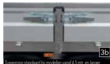
3b Tussenring standaard bij modellen vanaf 4,5 mtr. en langer