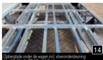
14 Opberglade onder de wagen incl. vloerondersteuning (standaard bij de "Multi"-modellen)