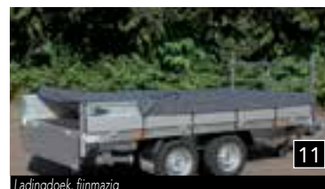
11 Ladingdoek, fijnmazig