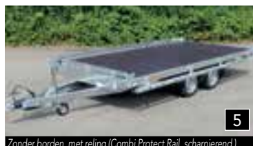
5 Zonder borden, met reling (Combi Protect Rail, scharnierend)