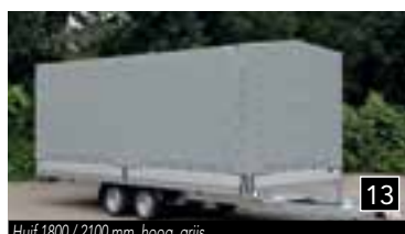
13 Huif 1800 / 2100 mm. hoog, grijs