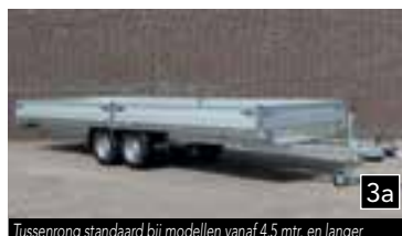
3a Tussenring standaard bij modellen vanaf 4,5 mtr. en langer