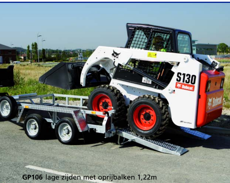
GP106 lage zijden met oprijbalken 1,22m