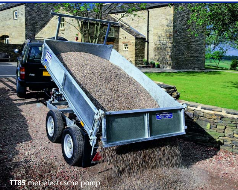
TT85 met elektrische pomp

De kippers zijn voorzien van een aluminium vloer (optie bij de TT85) en je kan zelf opteren voor vloerogen. Ook winch en draadzijden verhogingen behoren tot de mogelijkheden.