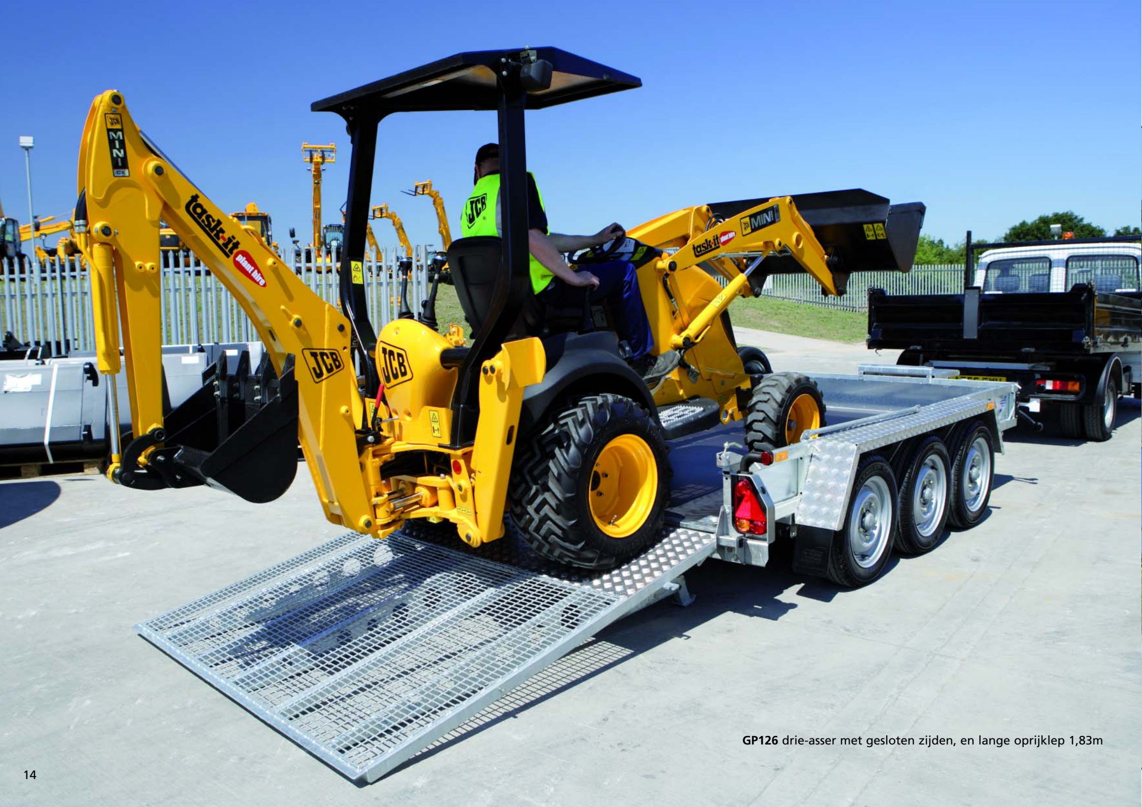
GP126 drie-asser met gesloten zijden, en lange oprijklep 1,83m