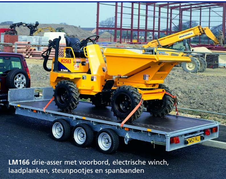
LM166 drie-asser met voorbord, elektrische winch, laadplanken, steunpootjes en spanbanden

Het maximaal toegelaten gewicht varieert van 2000kg tot 3500kg.