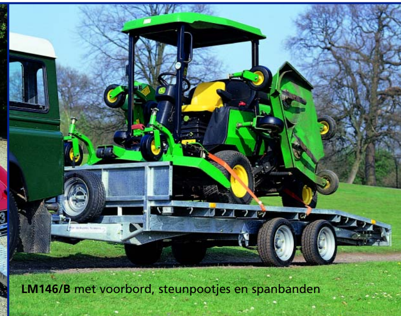
LM146/B met voorbord, steunpootjes en spanbanden