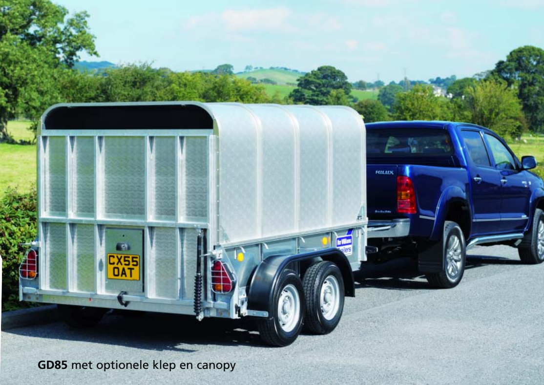
GD85 met optionele klep en canopy