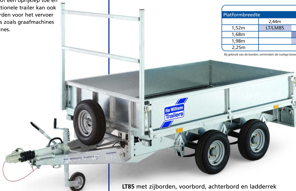
LT85 met zijborden, voorbord, achterbord en ladderrek