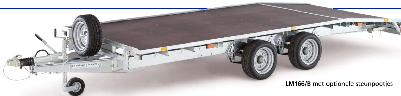
LM166/B met optionele steunpootjes

Beavertail-trailers zijn niet in alle landen goedgekeurd!