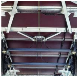
Chassis & Vloer