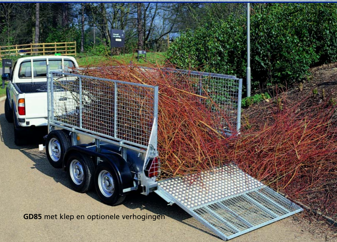
GD85 met klep en optionele verhogingen