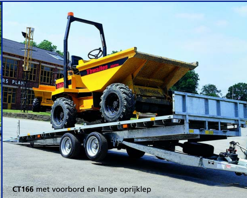
CT166 met voorbord en lange oprijklep

Voor eigenaars van machines/voertuigen die laag bij de grond hangen of voor depannegefirma's, is de tiltbed de ideale keuze! Deze heeft de voordelen van een platformtrailer met daarbovenop het kippende platform voor gemakkelijk laden.