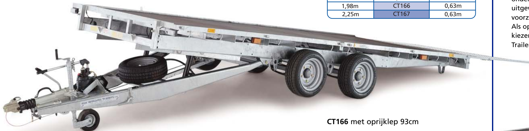
CT166 met oprijklep 93cm