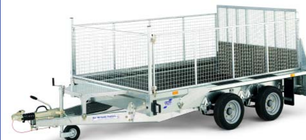
De GX serie is beschikbaar met verhogingen (enkel bij modellen met klep)

De GX serie bestaat uit geplooid gegalvaniseerde stalen secties met gedichte zijanten voor een grote flexibiliteit. De nieuwe vormgeving zorgt ervoor dat de machinebestuurder veilig uit de cabine kan stappen.