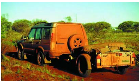
GD64 op route in de Australische natuur

De algemeen gebruik trailers hebben hun naam niet gestolen: ze worden gebruikt voor elk type lading van bouwmaterialen tot expeditiemateriaal.