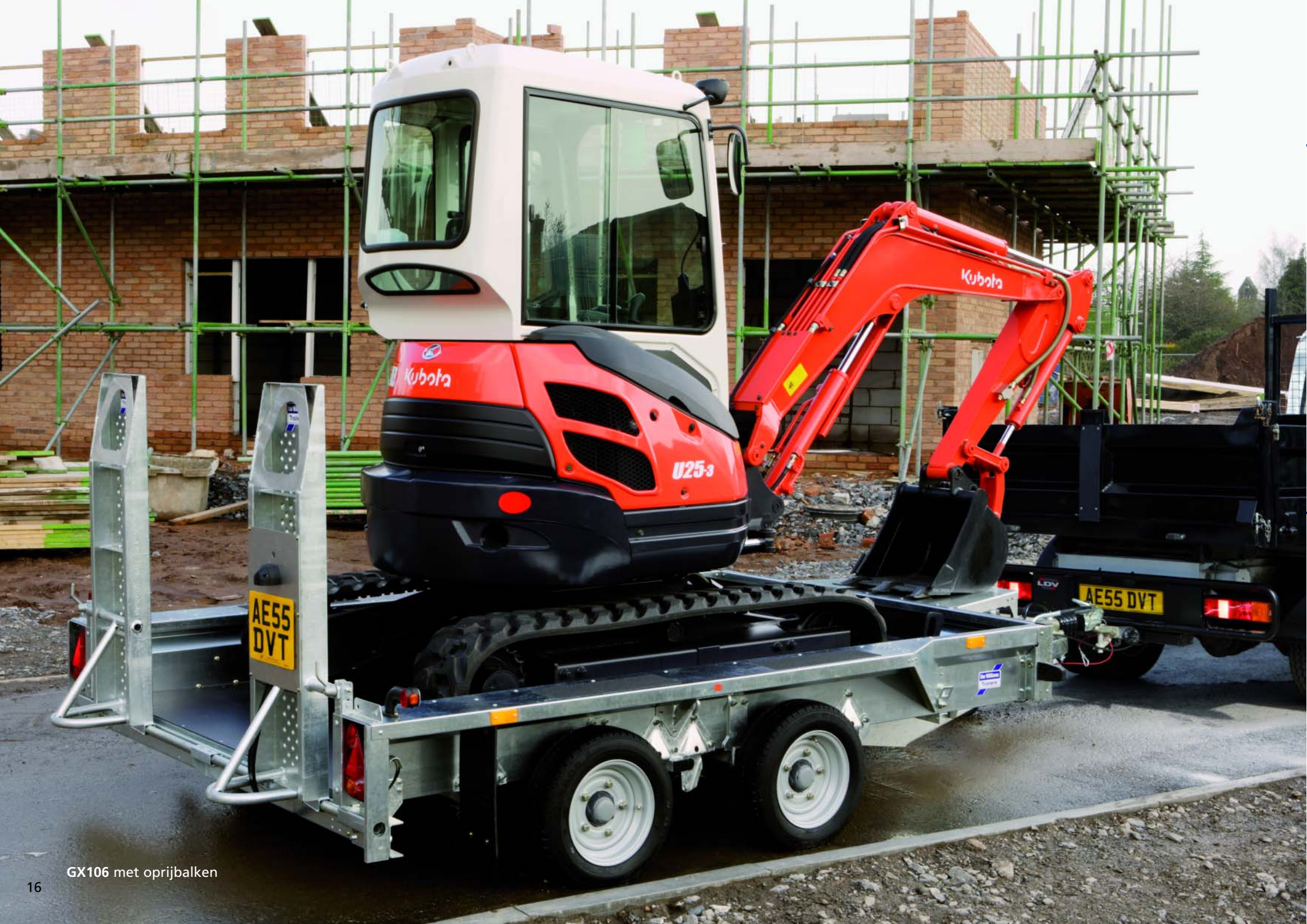
GX106 met oprijbalken