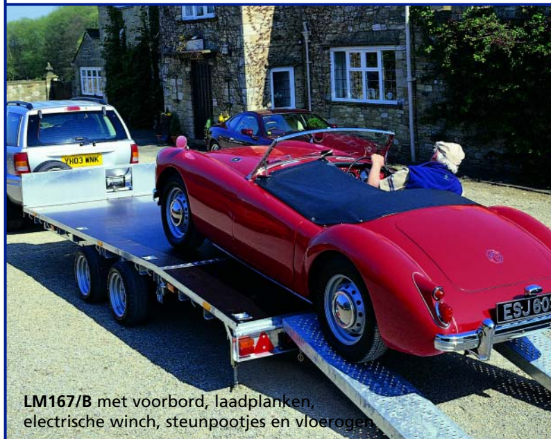
LM167/B met voorbord, laadplanken, elektrische winch, steunpootjes en vloerogen