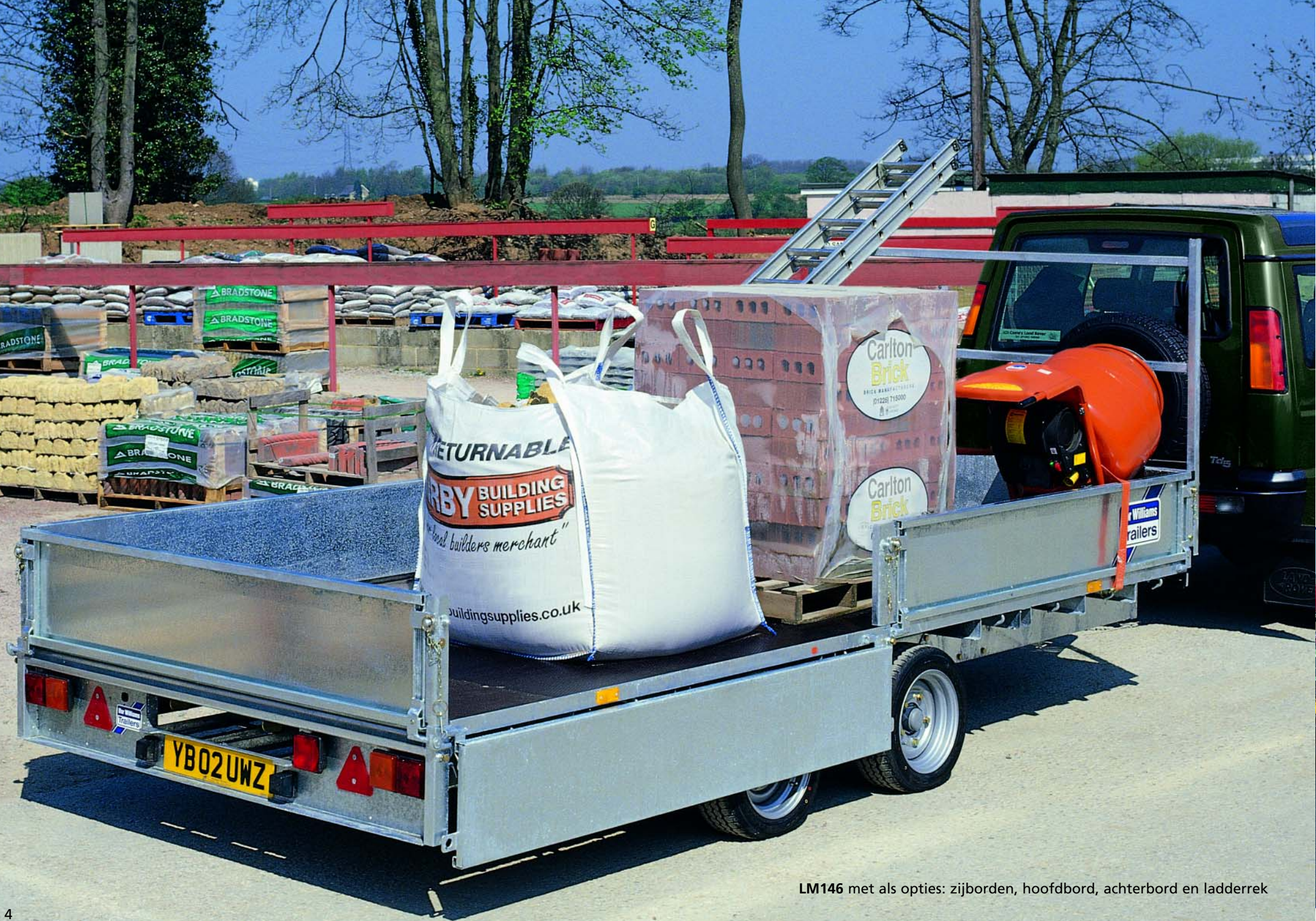
LM146 met als opties: zijborden, hoofdbord, achterbord en ladderrek