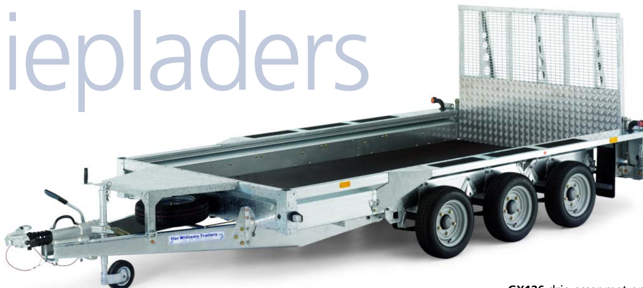
GX126 drie-asser met oprijklep