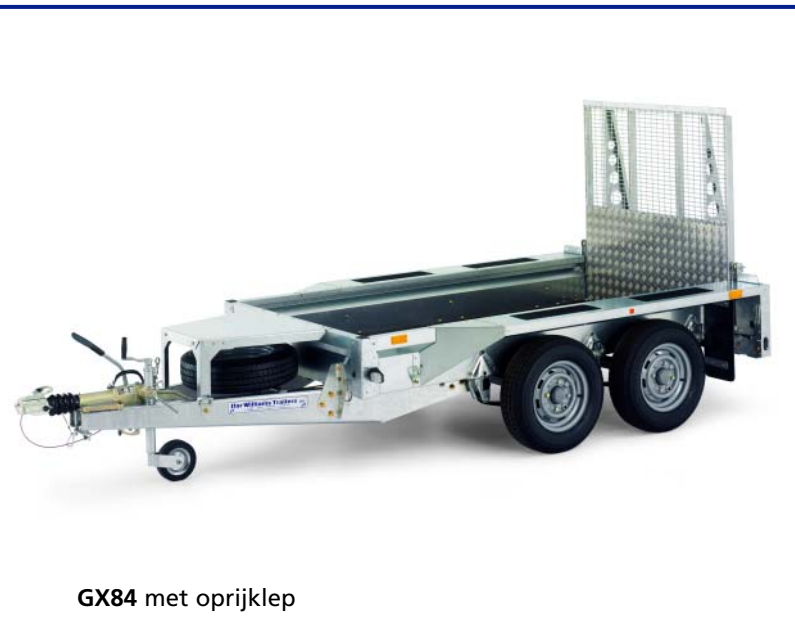
GX84 met oprijklep