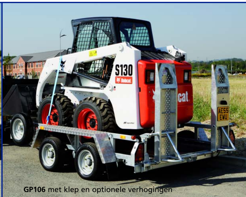
GP106 met klep en optionele verhogingen