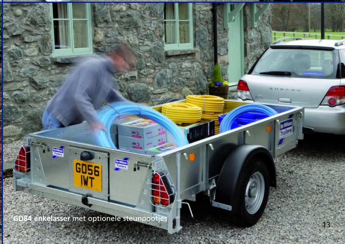
GD84 enkelasser met optionele steunpootjes