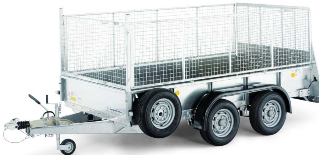
GD105 met oprijklep en de optionele maasstalen verhogingen