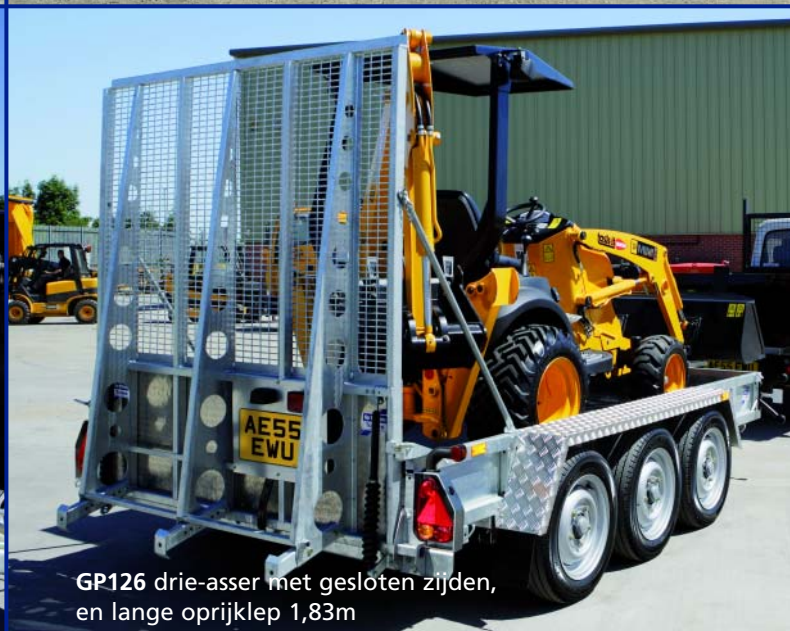
GP126 drie-asser met gesloten zijden, en lange oprijklep 1,83m

De Ifor Williams diepladersserie is speciaal ontworpen om graafmachines te transporteren en is een standaardvoertuig geworden van vele verhuurcentra. We bieden 2 types aan: De GP-serie (zie hieronder) en de GX-serie (zie verder).