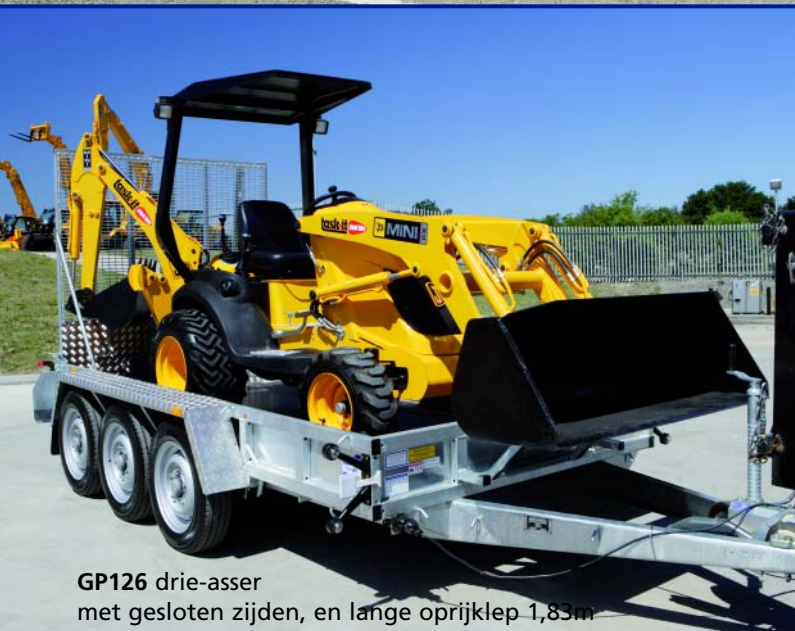
GP126 drie-asser met gesloten zijden, en lange oprijklep 1,83m