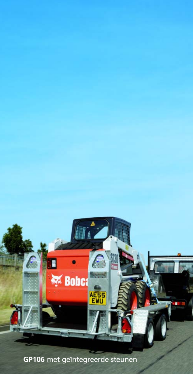
GP106 met geïntegreerde steunen

Productontwerp, beschrijvingen, kleuren, specificaties, enz. zijn correct op het moment van ter perse gaan. We streven er voortdurend naar onze producten te verbeteren en van tijd tot tijd kan dit leiden tot wijzigingen in ons assortiment of in onze individuele modellen.