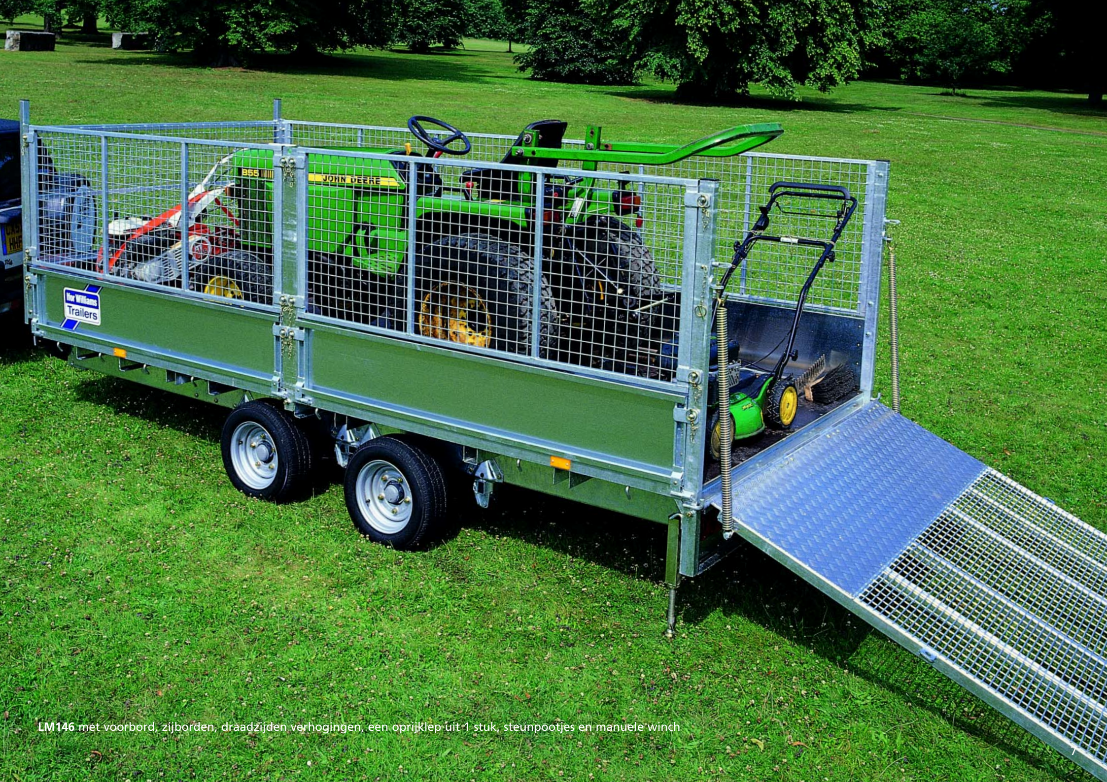
LM146 met voorbord, zijborden, draadzijden verhogingen, een oprijklep uit 1 stuk, steunpootjes en manuele winch