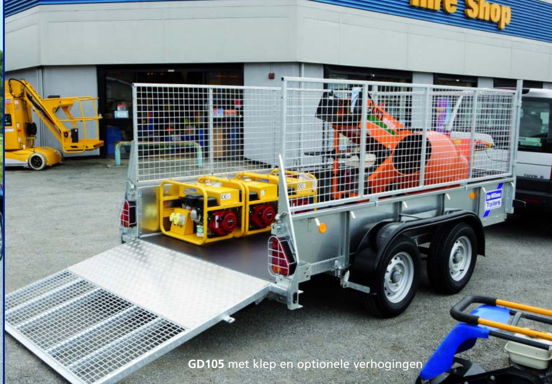
GD105 met klep en optionele verhogingen