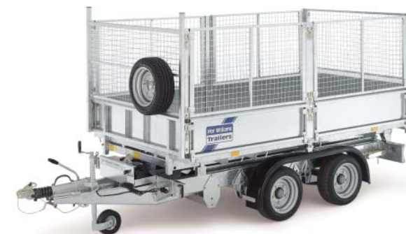
TT105 met draadzijden en steunpootjes