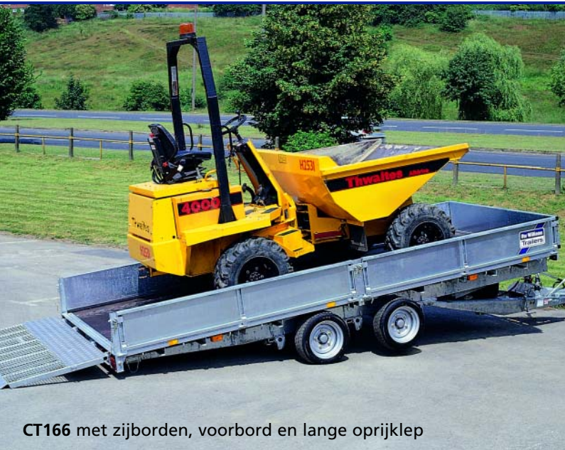
CT166 met zijborden, voorbord en lange oprijklep