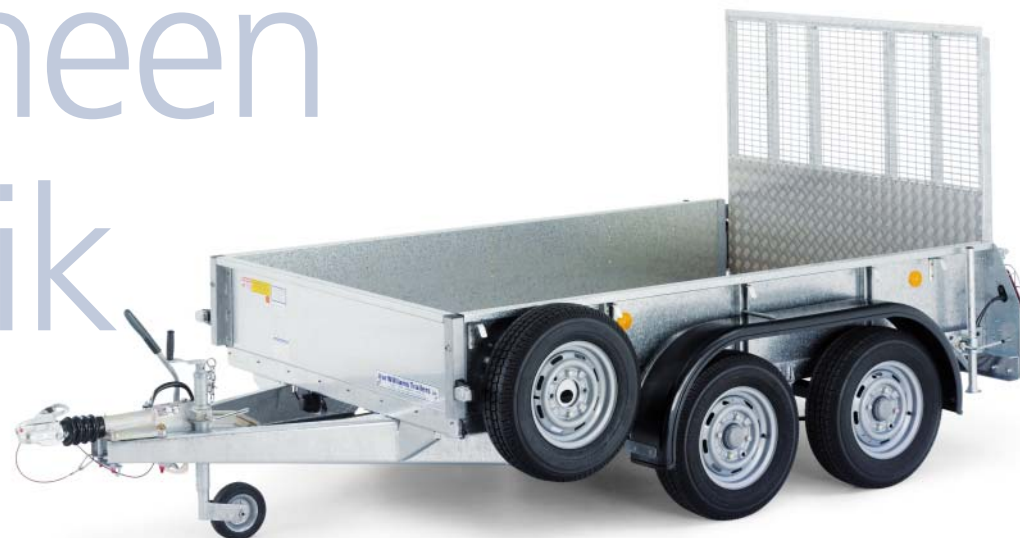
GD85 met oprijklep